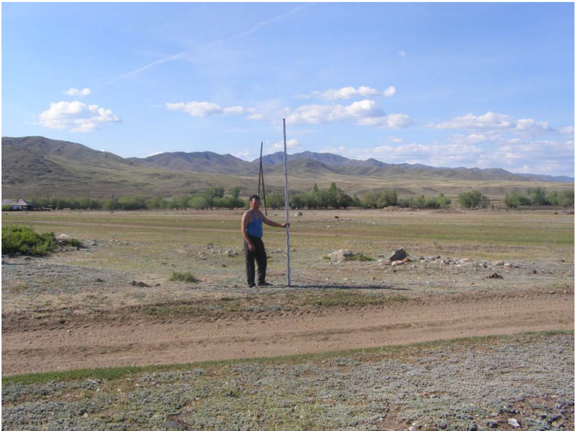
Фото кургана 1. Снято с юго-запада

Материалы фотофиксации объекта культурного (археологического) наследия федерального значения - «Могильник - V», расположенного в пос. Бурен-Хем, в Каа- Хемском кожууне Республики Тыва