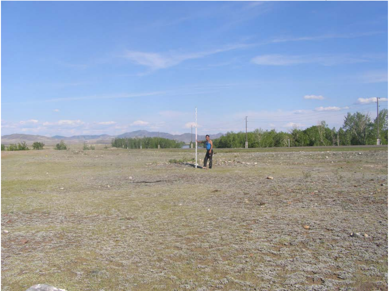
Фото кургана 2 . Снято с запада.