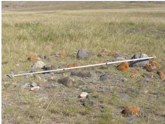
Фото кургана 2 . Снято с северо-востока.