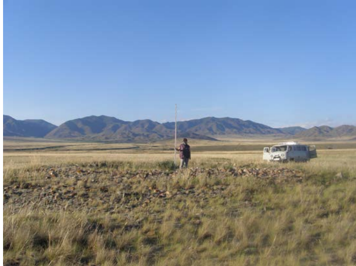
Фото кургана 1. Снято с юго-запада

Материалы фотофиксации объекта культурного (археологического) наследия федерального значения - «Могильник - III», расположенного в пос. Кундустуг, в Каа- Хемском кожууне Республики Тыва