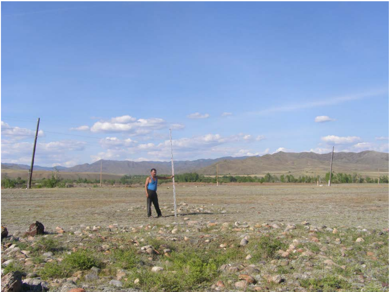
Фото кургана 1. Снято с юго-запада

Материалы фотофиксации объекта культурного (археологического) наследия федерального значения - «Могильник - II», расположенного в пос. Бурен-Хем, в Каа- Хемском кожууне Республики Тыва