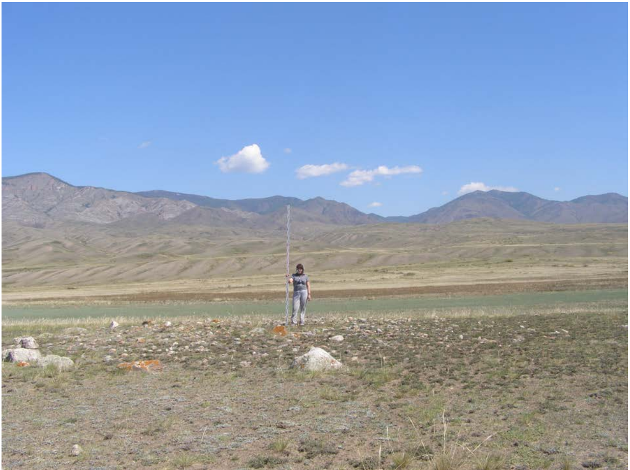
Фото кургана 1. Снято с юго-востока

Материалы фотофиксации объекта культурного (археологического) наследия федерального значения - «Могильник - I», расположенного в пос. Хая-Бажы, в Каа- Хемском кожууне Республики Тыва