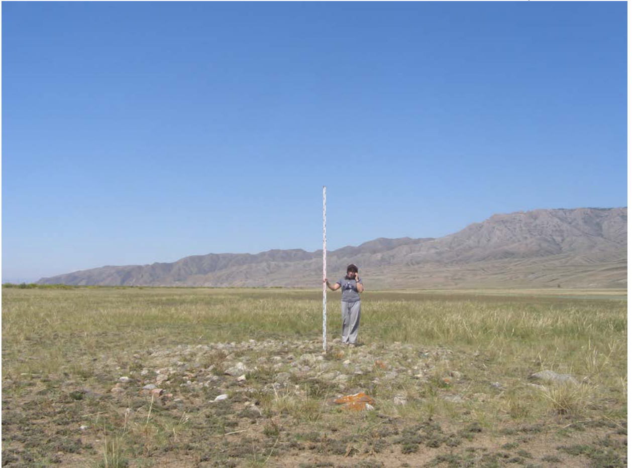
Фото кургана 2 . Снято с юго-востока.