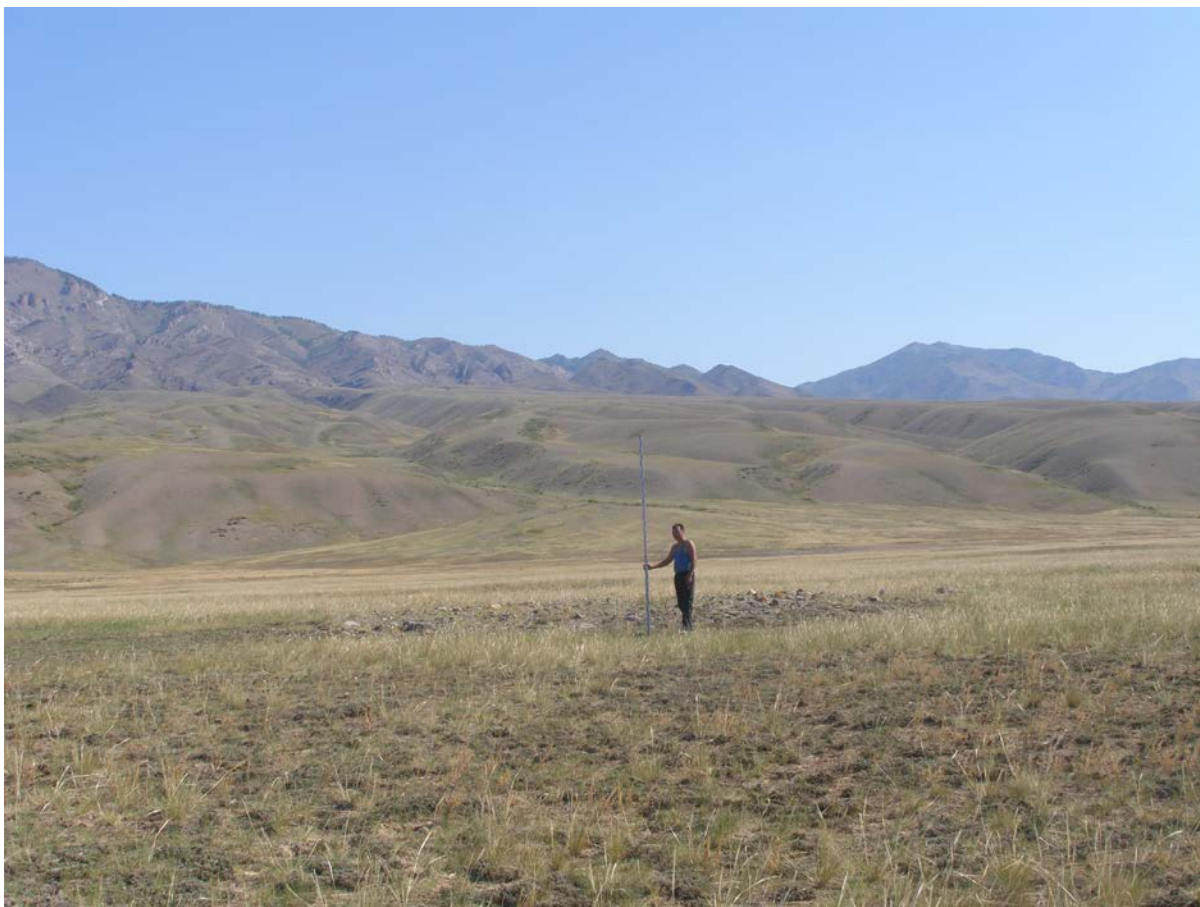
Фото кургана 1. Снято с юго-запада.

Материалы фотофиксации объекта культурного (археологического) наследия федерального значения - «Могильник - I», расположенного в пос. Суг-Бажы, в Каа- Хемском кожууне Республики Тыва