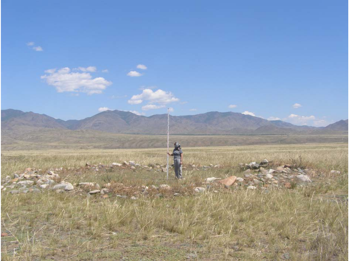
Фото кургана 2 . Снято с северо-запада